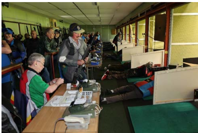
Regel Betrieb im Schiessstand