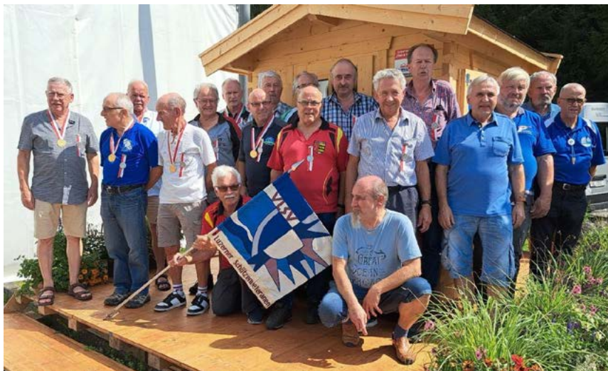
Teilnehmer am Ständematch der Luzerner Schützen-Veteranen

Pech hatte das Schützenteam in der Kat D, mit einem Punkt Rückstand auf den drittplatzierten (AG 751 Pkt.) belegten sie mit 750 Punkten den undankbaren 4. Rang. Bei den Pistolenschützen P25 belegte LU mit 565 Punkten den 5. Rang und beklagte einen Nuller. Das Team P50 erreichte den 7. Rang.